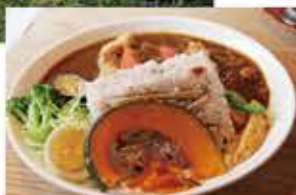
魚梁瀬ダムカレー

営業日 日・祝日 ※ダムカレーは要予約 営業時間 AM11:00～PM2:00 (L.O. PM1:30) TEL 0887-43-2039