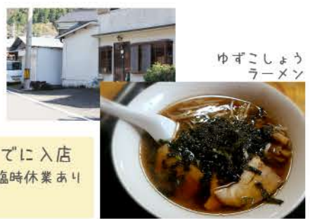
ゆずこしょう ラーメン

営業時間 AM11:00 ~ PM1:00までに入店 定休日 土・日・祝日 ※ほか、臨時休業あり TEL 0887-44-2625