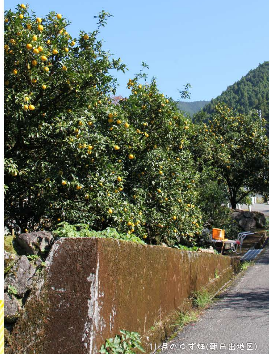
11月のゆず畑(朝日出地区)